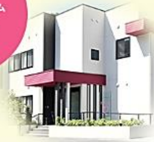
医療法人社団 医務会 まごころ

全人的医療とは、特定の部位や疾患に限定せず、患者様の心理や社会的側面なども含めて幅広く考慮しながら、個々人に合った総合的な疾病予防や診断・治療を行う医療のことです。