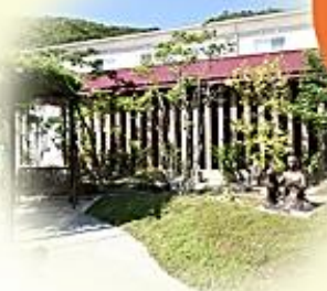
医療法人社団 医務会 おもいやり