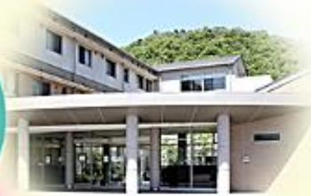
医療法人社団 医務会 松本ホームメディカルクリニック