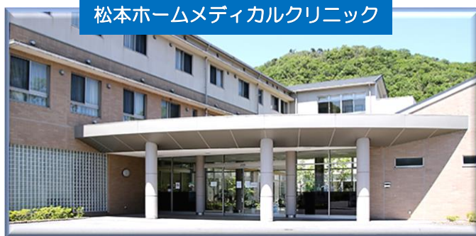
松本ホームメディカルクリニック

充実した設備と入院病棟を備えた有床クリニックです。 神戸市北区有野町唐櫃50-1 ☎078-982-1116