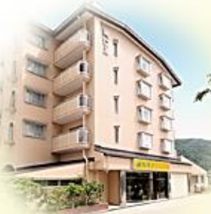
医療法人社団 医務会 松本クリニック